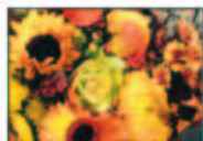
SONY ERICSSON S700i.

Östarp Siemens Samtidigt skiljer en jumbo ut sig - Siemens S65, som har både dåligt skärpa och urvattnade färger. Sony Ericsson och Nokia lyckas olika bra i olika situ-